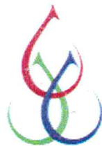
Blutspendezentrale SAAR-PFALZ gGmbH

Auf Grundlage der Zertifizierungsentscheidung vom 30.11.2023 bescheinigt die ClarCert GmbH – Zertifizierungsstelle für Managementsysteme, dass die